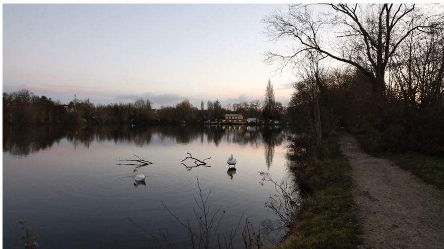
Un étang de Vert-le-Petit